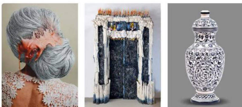
Natacha Lesueur Fée organique, 2020. Série Humeurs des fées, Monotype à la mine de graphite sur éprouvette photographique pigmentaire fine art