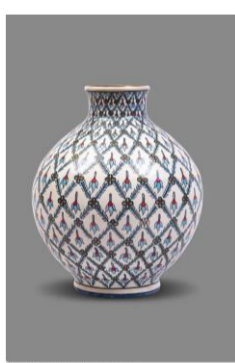
© Gumri & Caron & Bachelot / Fondation Bullukian

L'autre versant de l'exposition présente les céramiques artisanales de l'atelier Gumri qui réhabilite depuis 2014 un savoir-faire ancestral datant du XVI e siècle, celui des potiers arméniens de Kütahya. Histoire de rappeler que derrière la haute technicité et l'ornementation des poteries recréées se jouent la transmission et la survie d'une culture arménienne anéantie par le génocide de 1915.